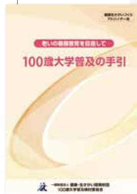
「100歳大学」を普及させるための手引書